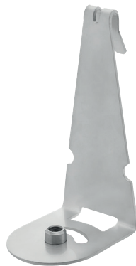
Standard Duty: Montagehalterung Schutzgitter